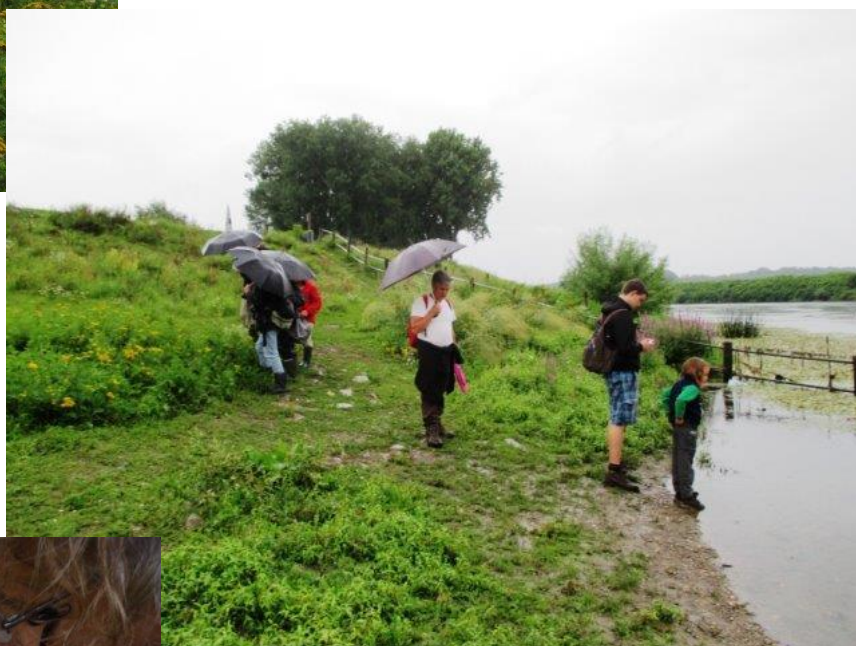
aan de boorden van de Maas