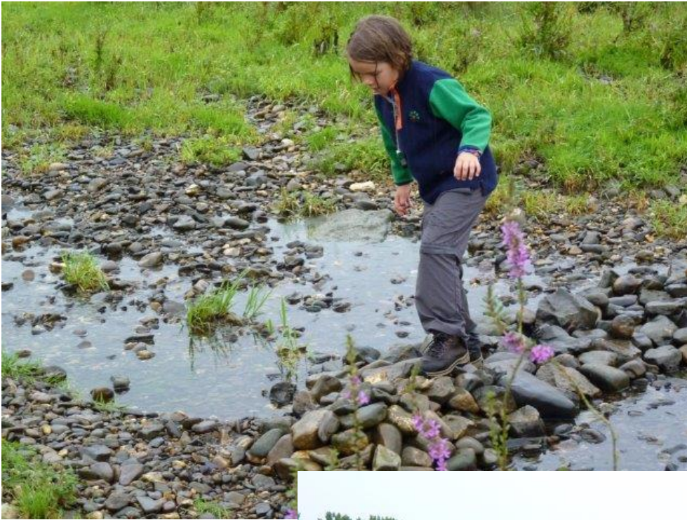
onze jongste slobkous was ook weer van de partij