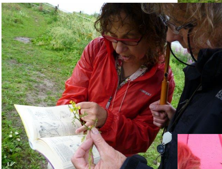
onder moeders paraplu....