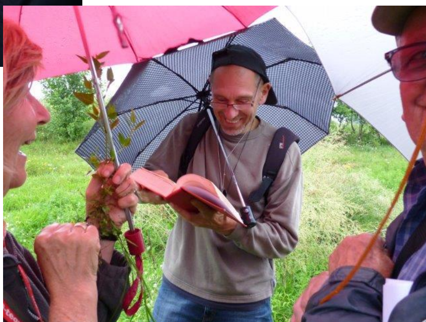
is dit een flora of een moppenboek?